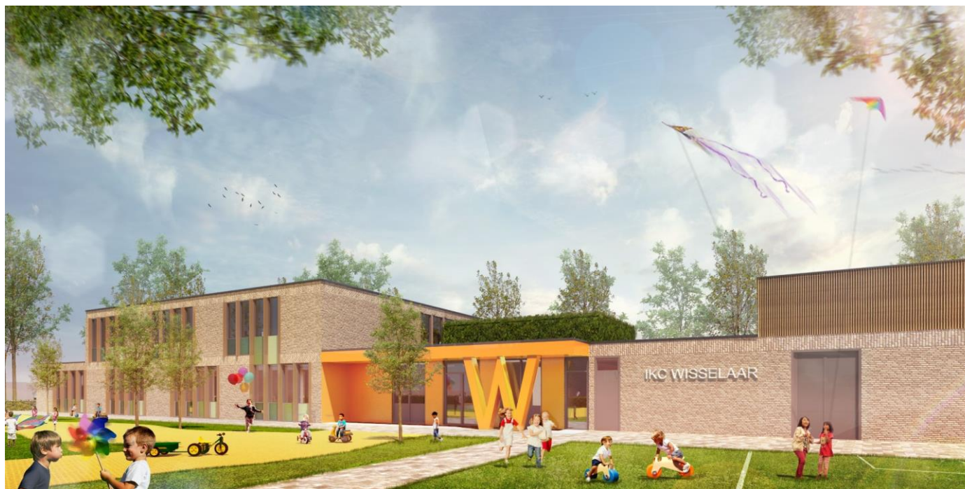
De verwachting is dat de school in juni 2020 gereed is, daarna wordt de speelplaats nog in orde gemaakt.

KBS De Wisselaar Vlaanderenstraat 56 4826 AH Breda 076 - 5871177 kbsdewisselaar_info@inos.nl